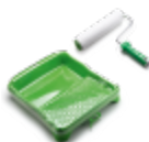
Kit rouleau parquet